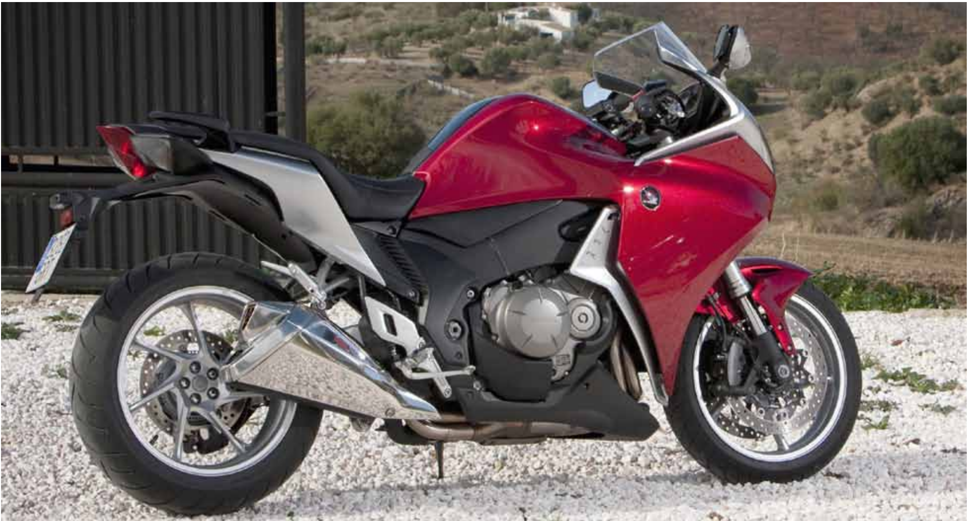
IMAGE-SYKKEL: Større og sterkere motor, innovativ design og kompakt konstruksjon gjør VFR 1200 til en spennende sportstourer. En sportstourer som skal videreføre og heve VFR-imagen og skaffe Honda et solid fotfeste i den mest sporty delen av sportstouringmarkedet.

Når man går VFR 1200 nærmere etter i sømmene, er det imidlertid ingen grunn for å hevde at Honda er konvensjonelle.