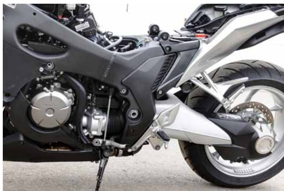
MYK KRAFTOVERFØRING: Drivakselen munner ut av motorblokka på undersiden av svingarms-opplagringen. Dette skal eliminere kardangreaksjonen. Drivlinja har også flere rykkutjevner som skal gjøre kraftoverføringen myk.

Selv om den mangler R-syklens lekne dynamikk, føles den mer sporty enn de nærmeste konkurrentene. Ved et par anledninger, mer eller mindre ufrivillig, fikk vi også prøvd bremsene. Hondas ABS-bremser er ekstremt effektive.