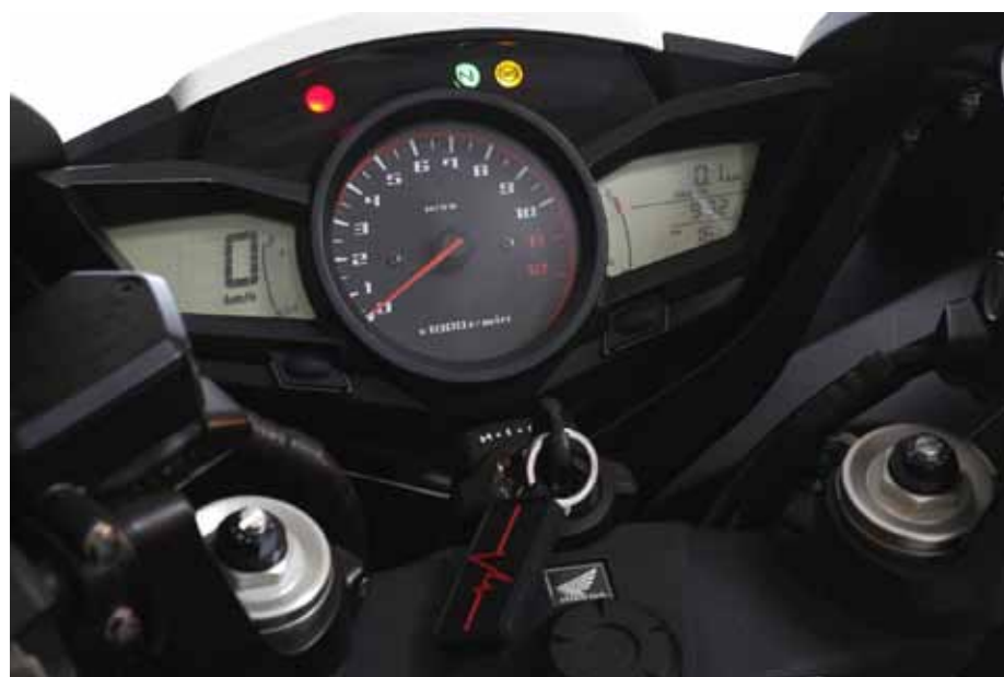
TRADISJONELL: Instrumenteringen er tradisjonell, med mekanisk turteller og digital tilleggsinformasjon.

Selv om den mangler R-syklens lekne dynamikk, føles den mer sporty enn de nærmeste konkurrentene. Ved et par anledninger, mer eller mindre ufrivillig, fikk vi også prøvd bremsene. Hondas ABS-bremser er ekstremt effektive.